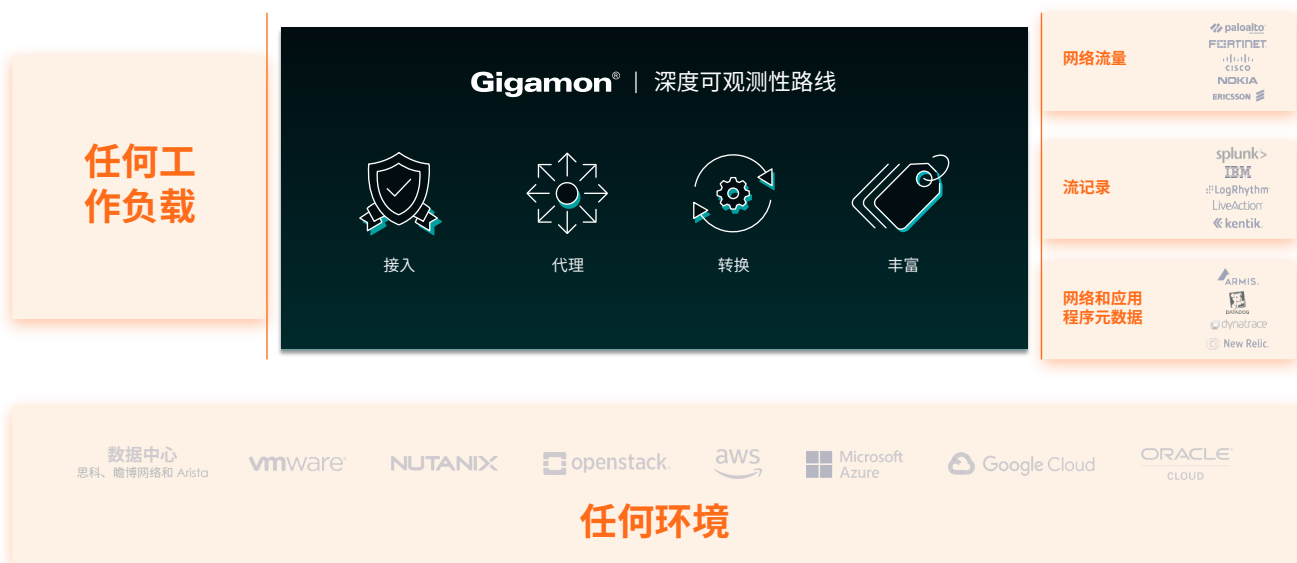
图 1: Gigamon 深度可观测性路线可从任何来源获取动态数据，并将切实可行的网络级情报发送到任何安全或可观测性工具。

Gigamon 通过消除安全与性能盲点，以及使用切实可行的网络衍生情报和见解补充指标、事件、日志和追踪 (MELT)，帮助保护您的混合云基础架构。通过提供借助深度数据包检测提取的信息，Gigamon 深度可观测性路线可为您当前的 SIEM、APM 和可观测性工具集带来更多安全用例。这些安全用例包括 1) 发现网络上的资产和 API 通信，2) 使用弱密码或即将过期的 TLS 证书识别托管或非托管主机，以及 3) 检测未经授权的活动，如加密挖矿。