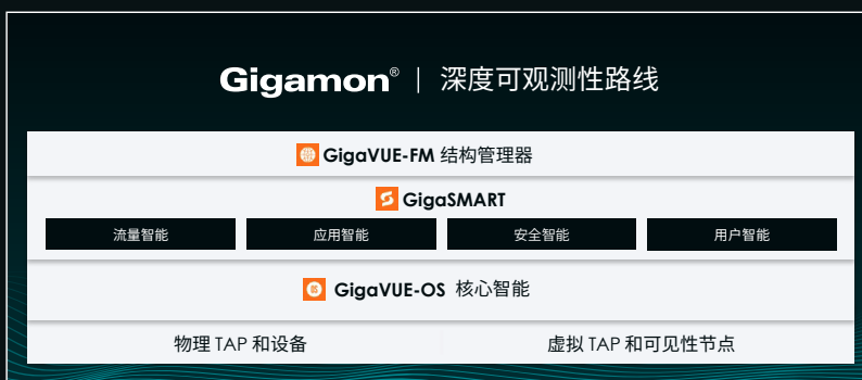
图 2: 适用于物理和云基础架构的 Gigamon 深度可观测性路线组件。